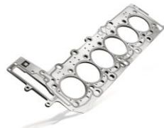
ZYLINDERKOPF- DICHTUNGEN 11%