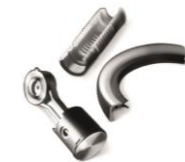
KUNSTSTOFF- TECHNIK 7%