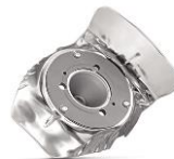
ABGASNACH- BEHANDLUNG 1%