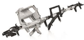
LEICHTBAU/ ELASTOMERTECHNIK 27%